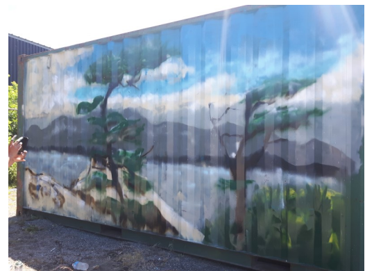
Les conteneurs de St. Catharines, ornés de magnifiques murales.