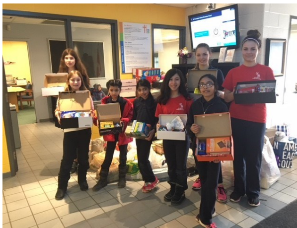
Des jeunes vincentiens de Saint Matthew à l'école St. Bernadette, pendant la collecte du Carême

Je veux consacrer ma vie à devenir meilleur et à faire un peu de bien.